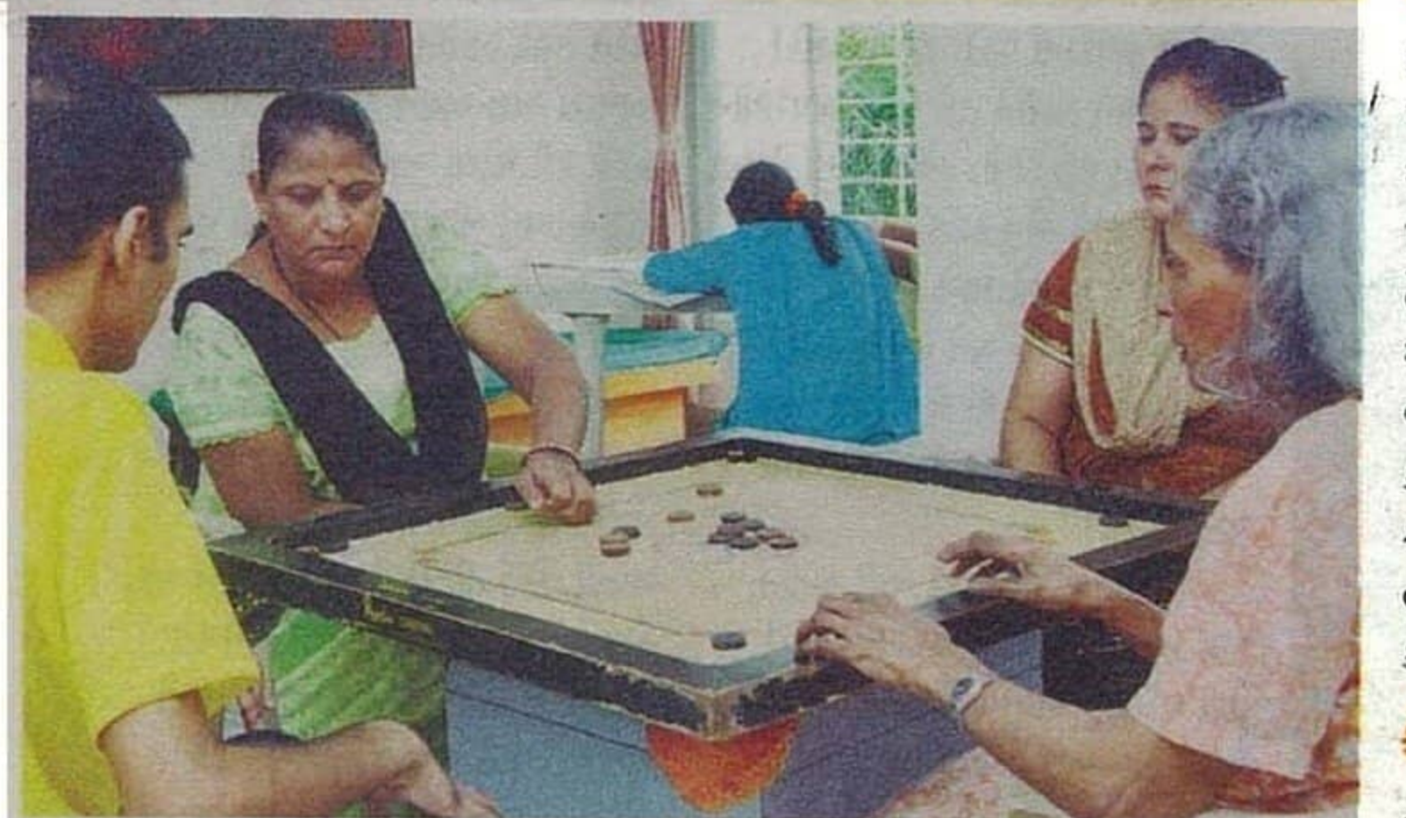
માનસિક દરદીઓના ઈલાજ માટે અનેક અંકિટવિટી સેન્ટરમાં ચાલે છે.