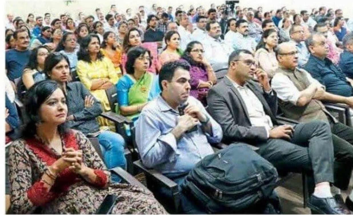
आयएमए हॉल : इंडियन मेडिकल असोसिएशन, नाशिक शाखेतर्फे रविवारी झालेल्या 'रिफ्रेशकॉन-२०२०' मध्ये सहभागी राज्यभरातील डॉक्टर.